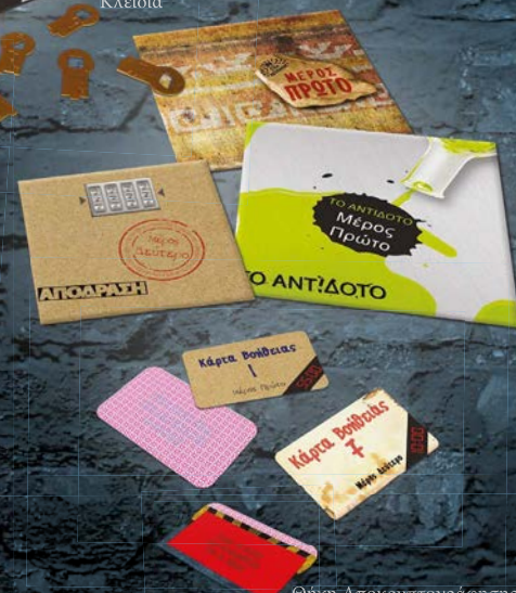
Θήκη Αποκρυπτογράφησης καρτών Βοήθειας